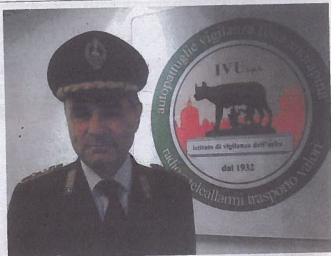
IVU - Nella foto, il Tenente Colonnello Mauro Tosi

E' il prodotto di un confronto aperto e costruttivo con le parti sociali che ci ha consentito, nell'ambito del tavolo regionale per l'occupazione, di mettere a sistema le risorse a disposizione e di ottimizzare la progettazione e l'attuazione degli interventi previsti